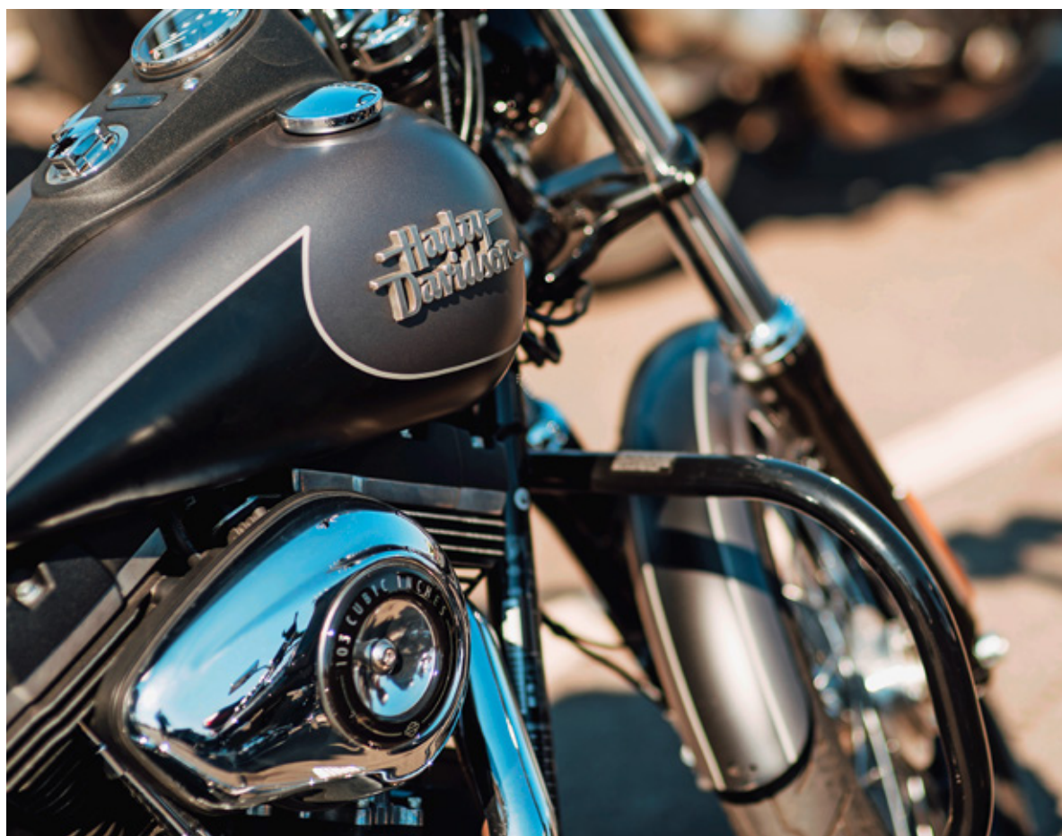
Im Avry Centre können Kinder mit Handicap oder Krankheit am 21. August eine Runde auf der Harley drehen.

Die Genossenschaft bedankt sich bei allen Famigros-Mitgliedern. In der Migros-App gibts jetzt einen digitalen Coupon mit fünffachen Cumulus-Punkten für das ganze Sortiment der Migros-Supermärkte und -Fachmärkte. Der Coupon ist bis zum 5. September gültig. Wer noch nicht Mitglied ist, meldet sich am besten gleich an, um von den Vorteilen profitieren zu können. Es winken das ganze Jahr attraktive Überraschungen. Infos: famigros.migros.ch