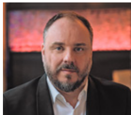
Matthias Goerne, baryton